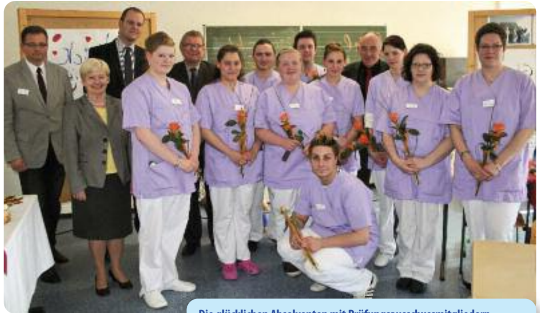
Die glücklichen Absolventen mit Prüfungsausschussmitgliedern und geladenen Ehrengästen.

Die staatliche Prüfung nach der Krankenpflegehilfeausbildung erstreckt sich über einen Zeitraum von zwei Monaten und besteht aus drei Teilbereichen, der schriftlichen, praktischen und mündlichen Prüfung. Die Absolventen erhalten vom zuständigen Regierungspräsidium bei erfolgreich bestandenen Prü-