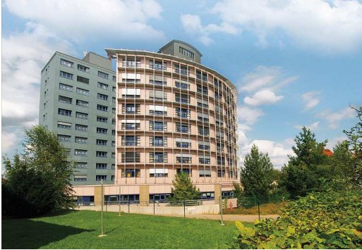
Kreiskrankenhaus Eschwege GmbH