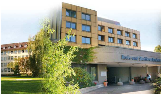
Kreis- und Stadtkrankenhaus Witzenhausen GmbH